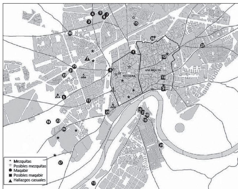
Lám. 4: Plano de la dispersión de mezquitas y cementerios en Córdoba (CASAL et alii, 2006 273).

negras ni tampoco para canalizar un arroyo " (COSTA, 2001: 183). Este canal contaría con un ancho de 1,7 metros y una profundidad de 1,2 metros, correspondiéndose el salmer con los restos de un pequeño puente que habría ayudado a cruzarlo. Asimismo, le da una cronología califal a todo el conjunto basada en los numerosos materiales cerámicos asociados (COSTA, 2001: 184) y que también se depositarían en el Museo Arqueológico de Córdoba.