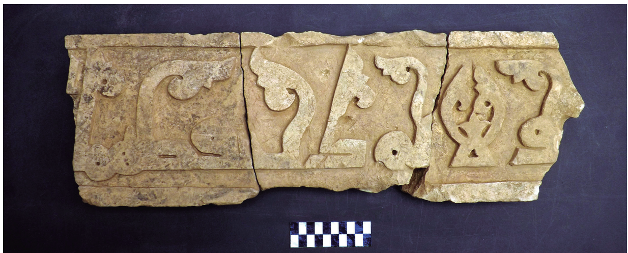
Lám. 1: Fragmentos con decoración epigráfica.

artículo busca determinar si el estudio de la decoración con motivo de ataurique y el del epígrafe cúfico pueden arrojar luz sobre la naturaleza del edificio exhumado en la misma excavación. De esta manera contribuiríamos también a una de las principales propuestas de la tesis arriba mencionada, que la decoración con motivo de ataurique, al igual que los remates de los caracteres cúficos (siempre que aparezcan