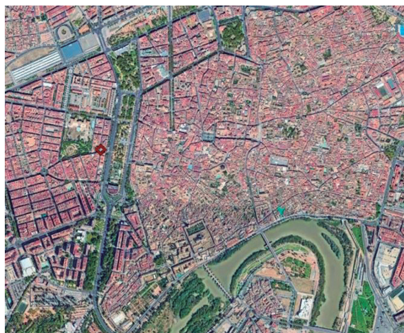
Lám. 3: Vista aérea de Córdoba. En rojo la ubicación del solar (elaboración propia).